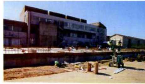
基礎コンクリート工事

現在特養に入所申込をいただいている皆様は、新施設への入所意向や居室の希望等についての調査に御協力をお願いしております。また、すでに水都苑に入所されている方でも、新たに整備する個室を希望される場合には御要望に沿いたいと考えていますのでお問い合わせ下さい。