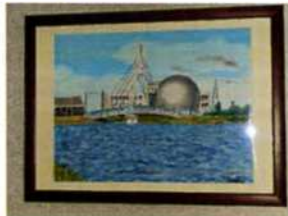
武雄 林 一 様